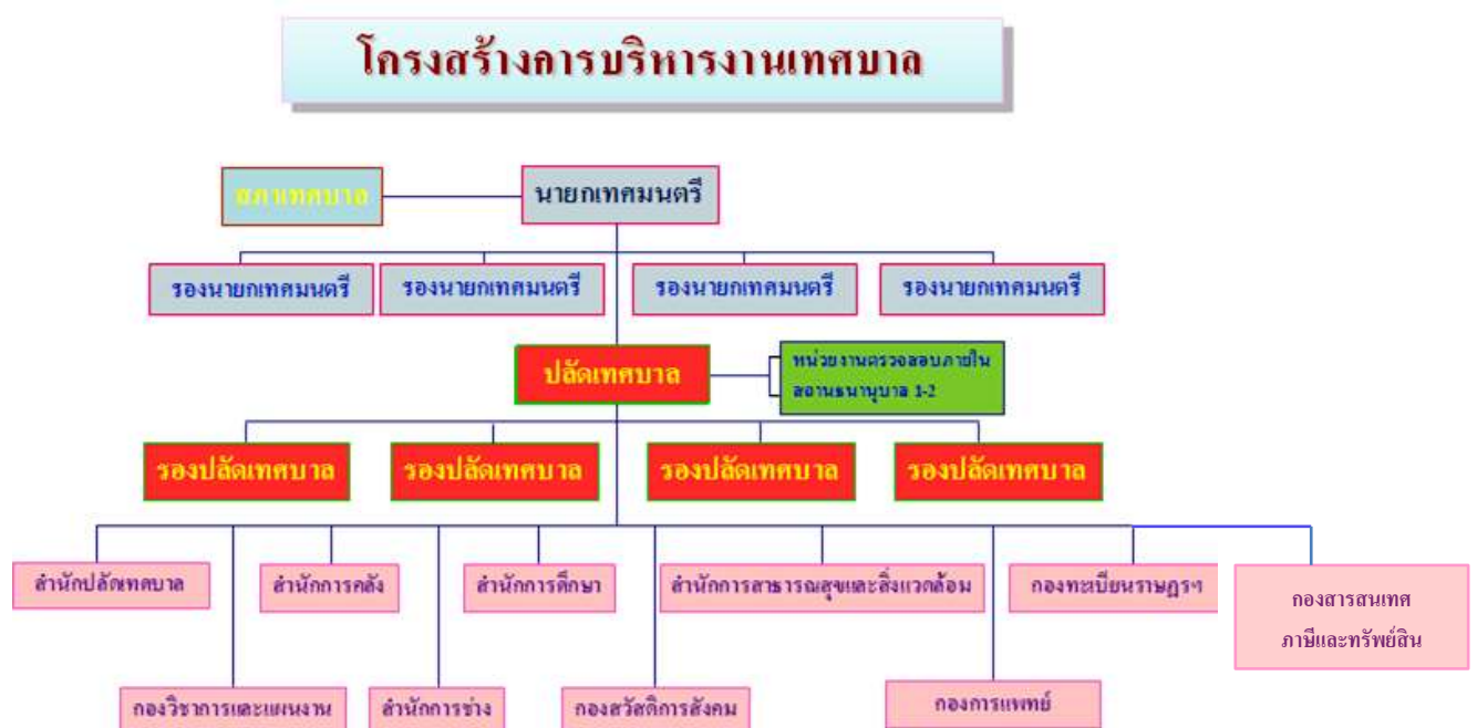
ภาพที่ 4 โครงสร้างการบริหารงานของเทศบาลนครอุดรธานี

มีหน้าที่รับผิดชอบเกี่ยวกับ การจัดทำ การปรับข้อมูล การใช้และการเก็บรักษา แผนที่ภูมิศาสตร์และทะเบียนทรัพย์สินโดยระบบเทคโนโลยีสารสนเทศภูมิศาสตร์ เพื่อใช้เป็นเครื่องมือในการจัดเก็บรายได้ การให้บริการประชาชนเกี่ยวกับข้อมูลแผนที่และทรัพย์สิน รวมทั้งการนำไปใช้ประโยชน์ในการพัฒนาท้องถิ่นในด้านต่างๆ